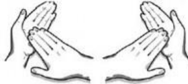
7. Sukamais judesiais trinamas kiekvienos rankos delnas.