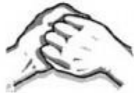
5. Kiekvienos rankos delnu trinami kitos rankos pirštai.