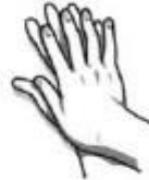
4. Suglaudžiami delnai, supinami pirštai ir trinami.