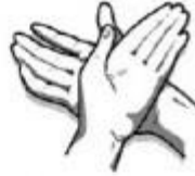
2. Dešinėsios rankos delnu trinamas kairiosios plaštakos viršus.