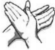
3. Kairiosios rankos delnu trinamas dešinėsios plaštakos viršus.